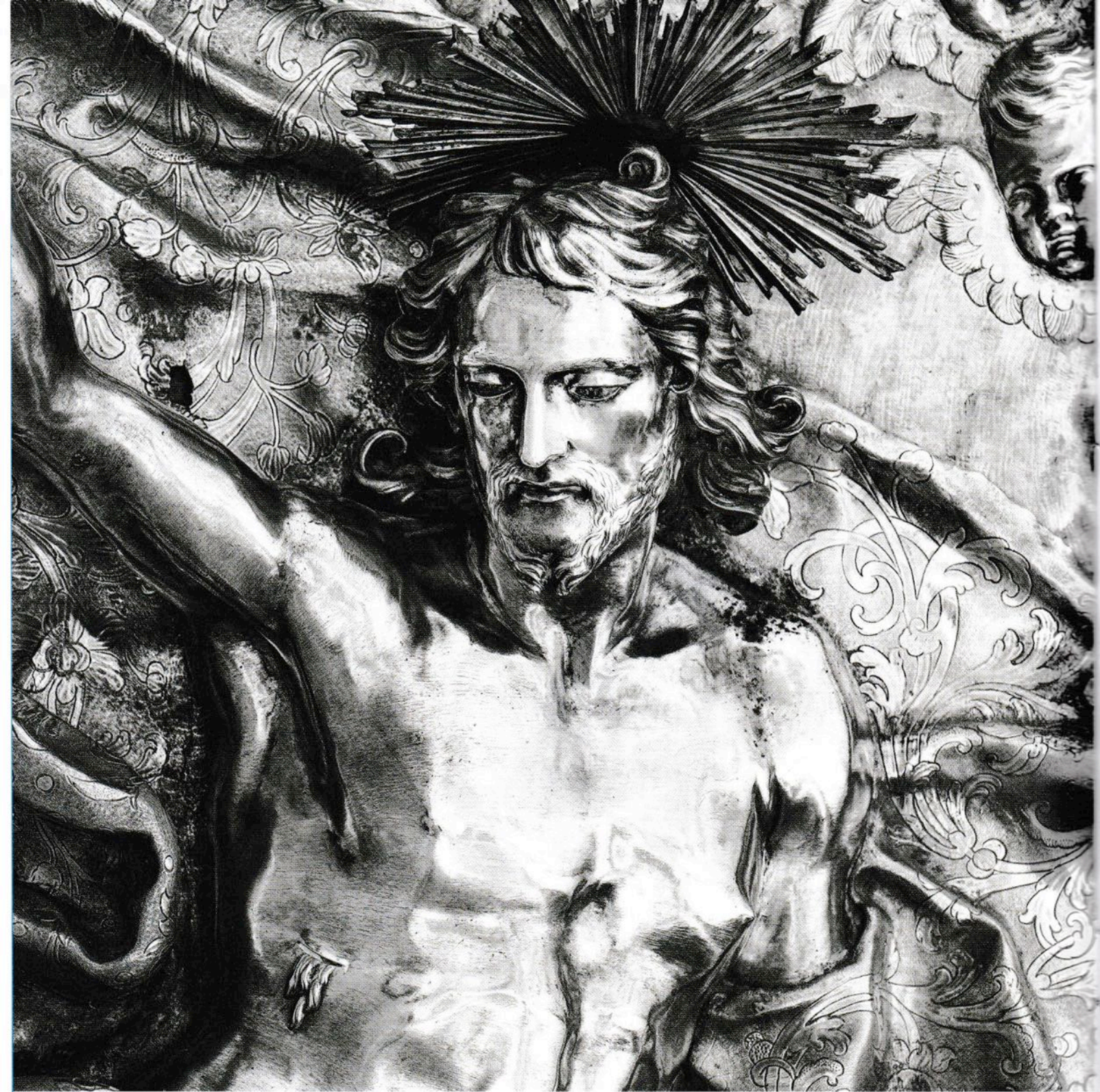
Détail de La Résurrection , bas-relief de l'orfèvre napolitain Gennaro De Blasio, 1736.